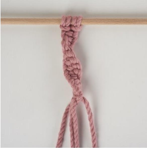
Spiralknoten - nach links gedreht