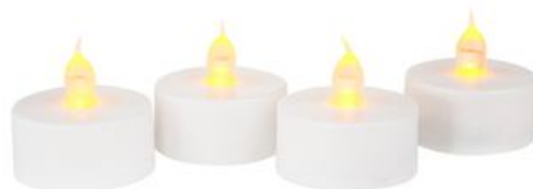
Bougies chauffe-plat LED VBS, 4 pièces, avec minuterie 11,65 CHF