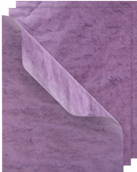
Soie de paille VBS, 50x70cm, 3 feuilles., Violet ● 6,20 CHF