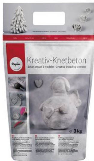
Béton créatif à modeler, 3 kg