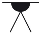
Nœud à tête d'alouette