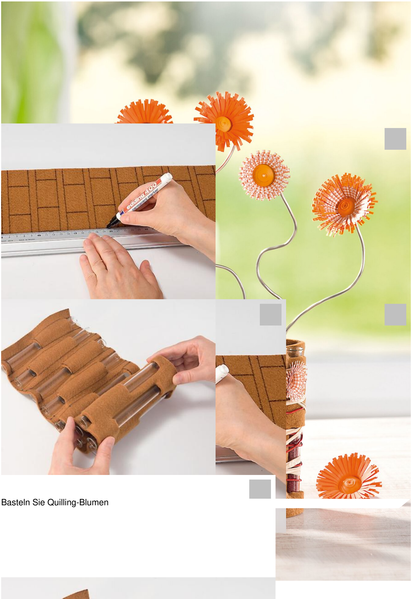
Basteln Sie Quilling-Blumen